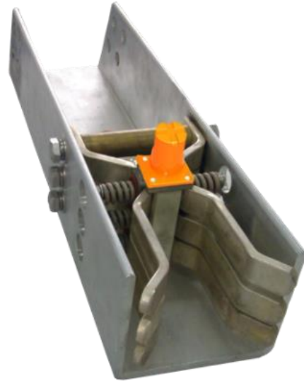
图刀闸温度传感器