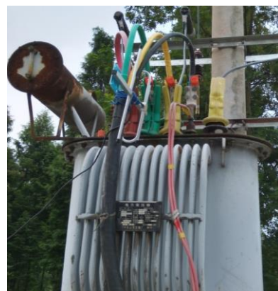
图 户外变压器测温现场安装图